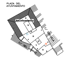
PLANTA DE ORDENACION